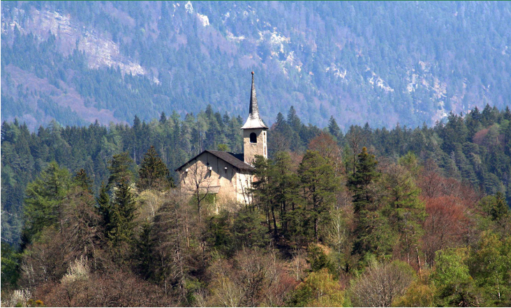
Kirche Son Gieri, Rhäzüns