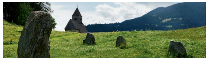
Megalithen bei der Kirche St. Remigius in Falera

150 SEITEN, 64 FARBBIEDER, 20 ROUTENKARTEN 20 HÖHENPROFILE PREIS CHF 28.-/EUR 18.- ISBN 978-3-7298-1151-5