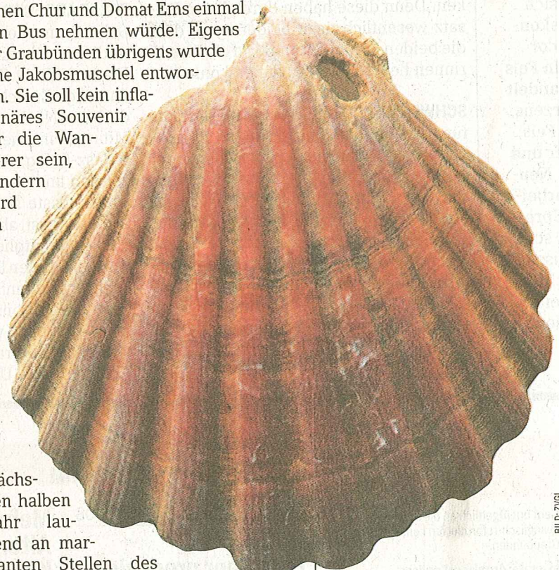
Jakobsmuschel als Grabbeigabe in Müstair