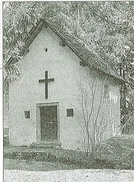
Auch die Kapelle Sogn Giacun (Heiliger Jakobus) beim Laaxer-Tobel, am alten Weg zwischen Laax und Sagogn, ist ein Hinweis auf den Pilgerweg durch die Surselva.

Nach bisherigen Erkenntnissen beginnt der Weg im Münstertal, führt über den Costainerpäss nach Scuol/Tarasp, durchs Unteren-gadin hinauf, über den Scalettapass nach Davos, dann über den